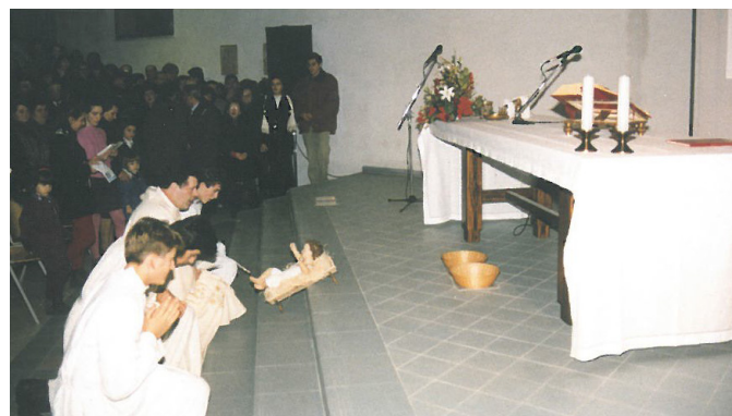
25 anni fa la Santa Messa di Natale